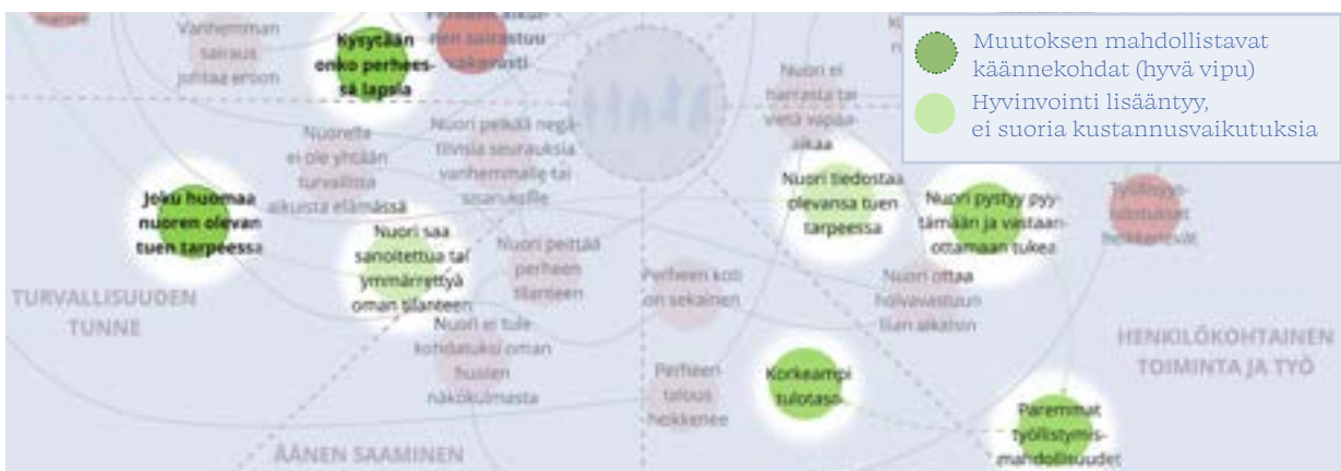
KUVA 6: HYVÄT VIPUPISTEET. Positiivisen muutoksen mahdollistavat elämänkäänneet jäävät helpposti piiloon.