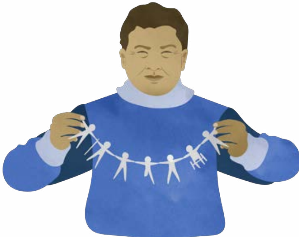
TAULUKKO 6: Keskeisiä työkaluja vaiheen 3 “Valmiiden toimivien ratkaisujen hyödyntäminen” toteuttamiseksi.