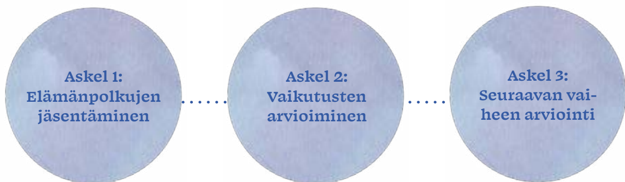
TAULUKKO 2: IHMISKESKEISEN VAIKUTTAVUUSLASKENNAN ASKELEET.